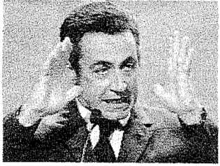
NICOLAS SARKOZY Il presidente francese ha tenuto il discorso di cui pubblichiamo ampi stralci domenica scorsa durante la sua visita in Cina